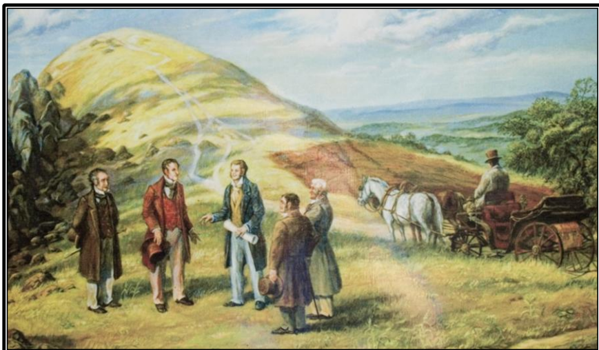
Setkání u Komorní hůrky v 19. století.

Mnoho pěkných zážitků z poznávání Chebska přeji turisté z odboru KČT Union Cheb