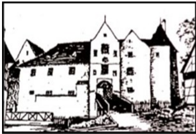
Obr. 5 Ostroh

První písemná zmínka o obci pochází z roku 1224 o Bedřichu z Hazlova, majiteli zdejšího hradu. Hrad byl postaven kolem roku 1200 v románském stylu. Jeho majitelé se postupně střídali a v roce 1682 získali panství Moserové, kteří hrad přestavěli na barokní zámek. Ten byl později několikrát upravovaný (naposledy v 30. letech 20. století). Dnes je objekt značně zdevastovaný a nepřístupný. Architektonicky cennější je kostel Povýšení sv. Kříže, který obklopují zámecké budovy. Jeho jádrem je románská a raně gotická stavba z první poloviny 13. století.