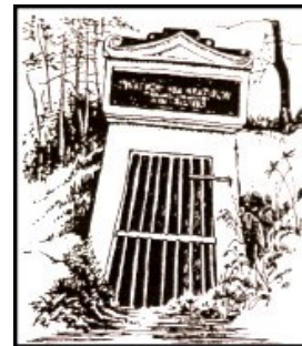
Obr. 2 Komorní hůrka

Vznikla ve čtvrtohorách jako poslední dozvuk vulkanické činnosti. Masivní 160 m dlouhá a 15 m hluboká jáma byla mylně považována za kráter. Těžily se z ní sypké vrstvy sopečného popela a strusky na udržování parkových cest ve Františkových Lázních. Dnes je skvělou geologickou učebnicí - je dobře vidět ukládání jednotlivých vrstev. S Komorní hůrkou je spjato i jméno básníka J. W. Goetha, který se spolupodílel na potvrzení teorie o původu sopky. Průkazné výsledky přinesl průzkum složitým systémem štol, které v polovině 19. století nechal prorazit hrabě Šternberk, spoluzakladatel pražského Národního muzea. Vpravo od vstupu do štol je na skále umístěn reliéf Goethovy hlavy.