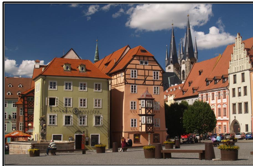
Chebský Špalíček, v pozadí věže kostela sv. Mikuláše a Alžběty.