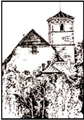
Obr. 4 Hazlov

První písemná zmínka o obci pochází z roku 1224 o Bedřichu z Hazlova, majiteli zdejšího hradu. Hrad byl postaven kolem roku 1200 v románském stylu. Jeho majitelé se postupně střídali a v roce 1682 získali panství Moserové, kteří hrad přestavěli na barokní zámek. Ten byl později několikrát upravovaný (naposledy v 30. letech 20. století). Dnes je objekt značně zdevastovaný a nepřístupný. Architektonicky cennější je kostel Povýšení sv. Kříže, který obklopují zámecké budovy. Jeho jádrem je románská a raně gotická stavba z první poloviny 13. století.