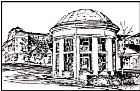
Obr. 6 Františkovy Lázně

a vyplnili Švédové. Hrad postupně chátral dále. Částečně byl obnoven před 1. světovou válkou, ale po roce 1945 jeho chátrání pokračovalo. S celkovou obnovou začalo městské muzeum ve Františkových Lázních, která skončila počátkem 90. let. Dnes má hrad opět podobu někdejšího rytířského sídla.