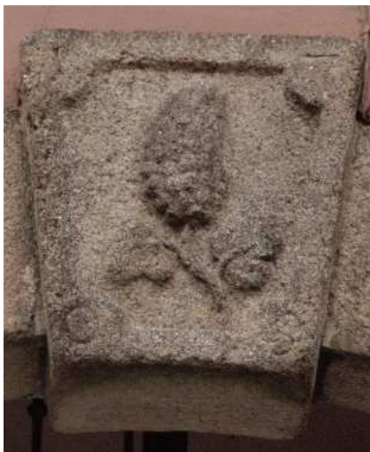
Umístění: Kamenná 203/28

Kašna je součástí komplexu Františkánského kláštera. O podobě románské stavby kláštera a kostela mnoho nevíme, neboť při velkém požáru města v roce 1270 byly obě stavby zničeny. Klášterní, ovocná a zeleninová zahrada, na kterou navazoval uzavřený dvůr s pivovarem a hospodářskými budovami, byla koncem 30. let 20. století s otevřením národopisného muzea v zadní části konventních budov přeměněna na okrasnou. Po obsazení kláštera a internaci řeholníků při akci "K", kterou provedly orgány totalitního komunistického režimu v roce 1950, byla zahrada opět proměněna v zeleninovou zahradu, tentokrát školní. V září 2002 byla zahrada po nákladné rekonstrukci znovu slavnostně zpřístupněna veřejnosti.