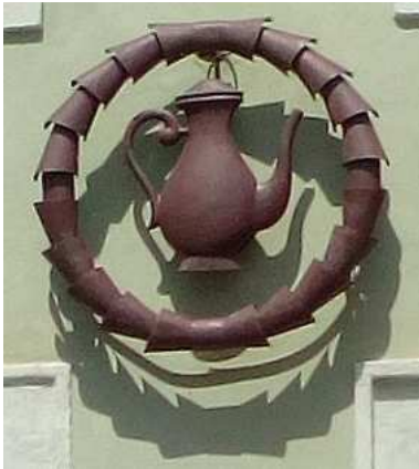
Umístění: nám. Krále Jiřího z Poděbrad 499/49