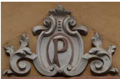
Umístění: Františkánské náměstí 35/6