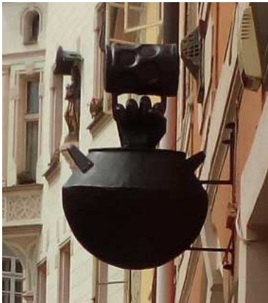
Umístění: Židovská 401/18